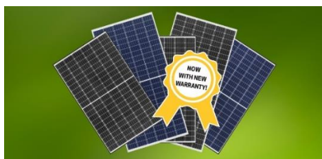
Nueva garantía de la industria de REC